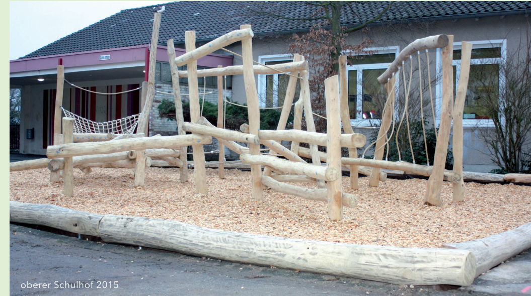
oberer Schulhof 2015